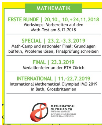
Abbildung 1 – Programm der Schweizer Mathematik-Olympiade für das Jahr 2018/2019

Unter den wichtigsten Terminen im Olympiade-Kalender ist die Lagerwoche Anfang März, welche für die Teilnehmenden der Finalrunde reserviert ist. Sie wird durch die beiden Prüfungen der Finalrunde abgeschlossen. Während dieser Woche lösen die Jugendlichen den ganzen Tag Mathematikaufgaben und nehmen an sozialen Aktivitäten - vor allem Spielen - am späten Nachmittag und am Abend teil. Es ist uns wichtig, eine kollegiale Atmosphäre zu pflegen und nicht den Wettbewerbsgedanken zu verstärken. Die Teilnehmenden sind eingeladen, ihre Argumentationen auszutauschen und gemeinsam an den hartnäckigsten Problemen zu arbeiten. Wir versuchen, ihre Neugier zu wecken und sie für die Schönheit der mathematischen Argumente zu sensibilisieren.