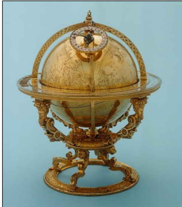
Abb. 4: Bürgi Globus, 1594