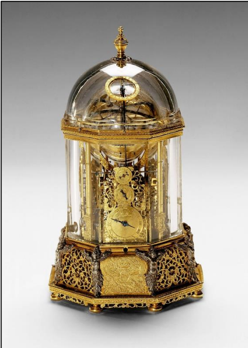
Abb. 3: Wiener Kristalluhr, 1622/1627

In dieser Tätigkeit brachte Jost Bürgi auf verschiedenen Gebieten herausragende Leistungen hervor: Als Uhrmacher baute er präzise, aber auch ästhetische Uhren (u.a. Wiener Kristalluhr, Abb. 3) und Himmelsgloben (Abb. 4) mit neuen technischen Lösungen. Als Instrumentenbauer konstruierte er genauere und einfacher zu handhabende Instrumente zur Vermessung und Sternbeobachtung (u.a. Sextant und Triangular-Instrument, Abb. 5). In der Mathematik schliesslich entwickelte er neue Rechenverfahren (u.a. die Prostasphäre und seine berühmten Progress-Tabulen (Abb. 6), ein Vorläufer der Logarithmentabellen), um die grosse Menge an Berechnungen in der Astronomie schnell und elegant auszuführen.