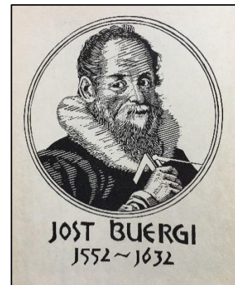
Abb. 1: Jost Bürgi, in einer Darstellung von Ägidius Sadeler (1619)

Jost Bürgi (1552 -1632) wird in Lichtensteig (Toggenburg, SG) geboren. Schriftliche Zeugnisse von Bürgi tauchen erst wieder auf, als er im Alter von 27 Jahren Hofuhrmacher am Fürstenhof Wilhelms IV. in Kassel wird. Im Jahre 1604 ernennt ihn Kaiser Rudolf II. zum Kaiserlichen Hofuhrmacher in Prag. Dort arbeitete Bürgi mit dem grossen Astronomen Johannes Kepler zusammen. Es sollte sich alsbald der vielleicht dramatischste Weltbild-Umbruch in der europäischen Kulturgeschichte anbahnen.