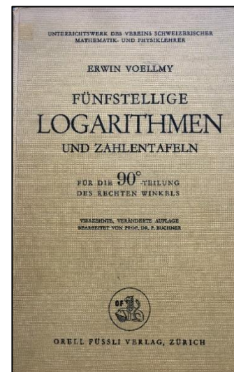
Abb. 2: "LOGARITHMEN" von Ernst Voellmy (1962)