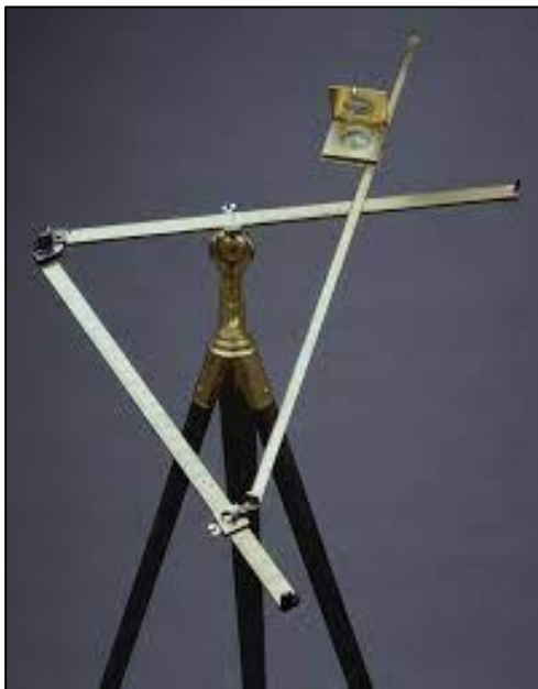
Abb. 5: Triangular-Instrument, 1613