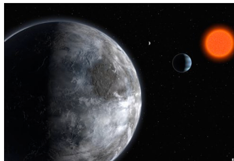
4 Exoplaneten kreisen um den Stern Gliese 581

Weil ein Stern und sein(e) Planet(en) um einen gemeinsamen Schwerpunkt kreist (en), kann mit der Radialengeschwindigkeitsmethode (RV-Methode) auf die Bahnparameter, Masse und Radius eines Planeten geschlossen werden. Aktuelle Verfahren detektieren die Geschwindigkeiten eines Sterns im Bereich 1m/s und das für Objekte, die in einer zweistelligen Licht-Jahr Distanz liegen. Ganz unglaublich!